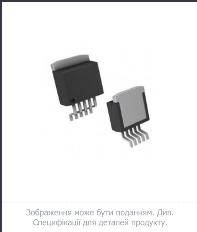
Зображення може бути поданням. Див. Специфікації для деталей продукту.